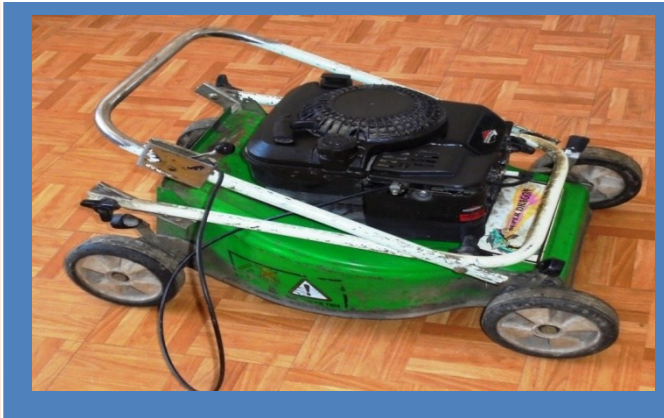
ماشین چمن زن بنزینی